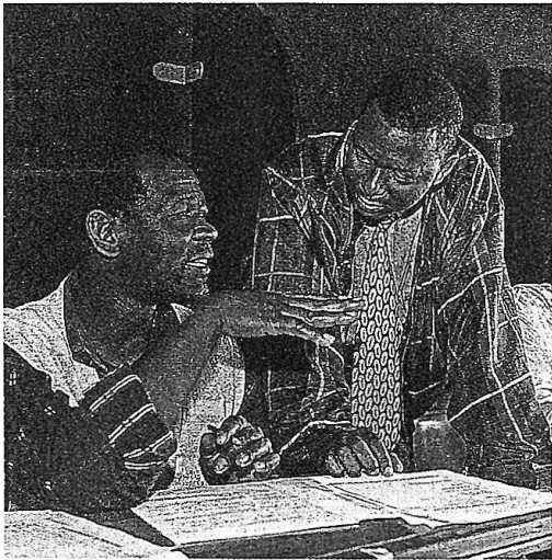
Titelfoto: Seminar für Jungunternehmer in Johannesburg/Südafrika