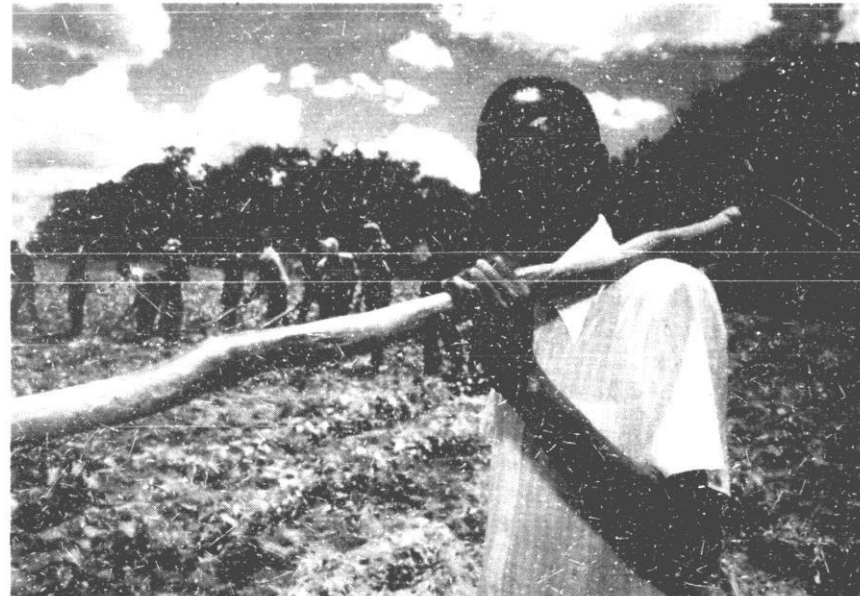
Sie sollen jäten, hacken und pflanzen statt kämpfen: Ein Ex-Soldat in Mosambik bei der Feldarbeit. Die Eschbomer GTZ fördert dort schon 50 entsprechende Projekte.